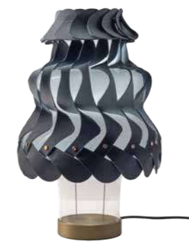
Tullissè von Poltrona Frau DESIGNER: ATELIER O

Bosque heißt Wald – daran erinnert diese zarte Struktur. Das Objekt schafft einen geschützten Raum im Raum, offen genug zum Durchsehen, dicht genug zum Zurückziehen