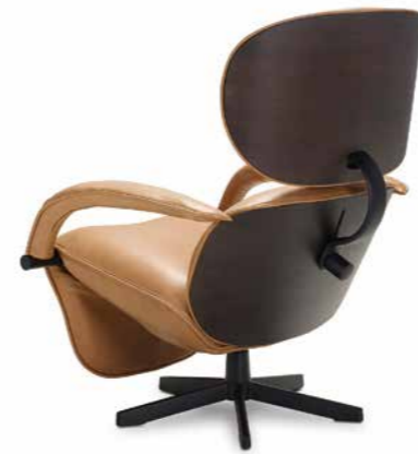
Andante von Jori DESIGNER: JEAN-PIERRE AUDEBERT

Mit seiner weichen Polsterung, höhenverstellbaren Rückenlehne und ausklappbaren Fußstütze kreiert der Sessel eine Insel der Gemütlichkeit