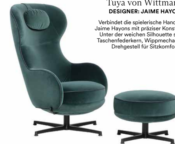
Tuya von Wittmann DESIGNER: JAIME HAYON

Sanft gerundete Holzbeine als markanter Akzent und eine ovale Tischplatte aus Nussbaum oder Eiche. Die reduzierte Form lebt von ihrer selbstverständlichen Präsenz