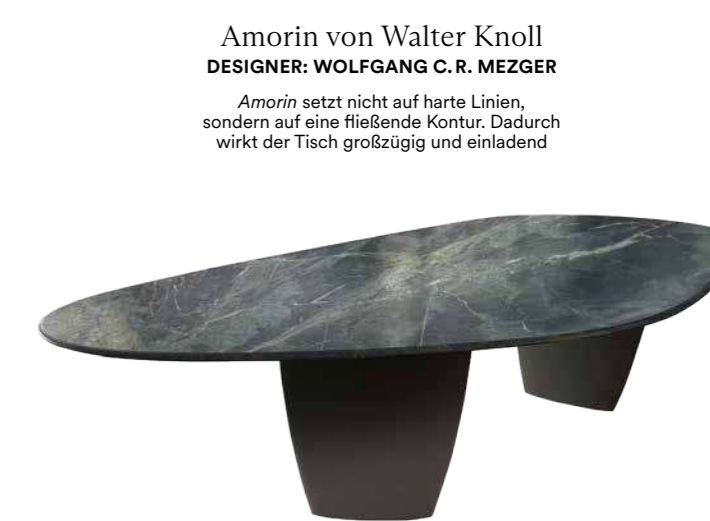
Amorin von Walter Knoll DESIGNER: WOLFGANG C.R. MEZGER

Der Schirm dieser Tischleuchte scheint im Raum zu schweben und erinnert an ein Ballett-Tutu. Geflochtene Lederbänder winden sich spiralförmig um die Konstruktion