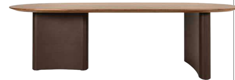
Nimbo von BW - Bespoke Works DESIGNER: LUCIE KOLDOVA

Amorin setzt nicht auf harte Linien, sondern auf eine fließende Kontur. Dadurch wirkt der Tisch großzügig und einladend