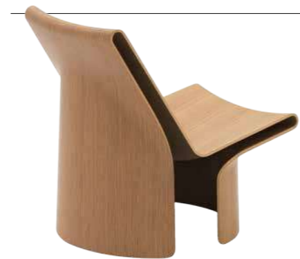
LayUp von Established & Sons DESIGNER: NATHAN MARTELL

Ein Spiegel, der selbst Haltung zeigt. Das vertikale Holzelement setzt einen ruhigen Akzent und macht aus einer schlichten Fläche ein Möbel zwischen Funktion und Schauobjekt